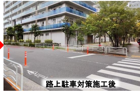
路上駐車対策施工後