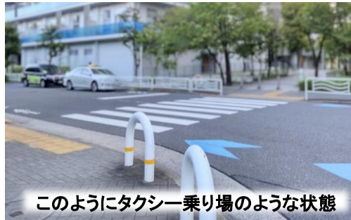
このようにタクシー乗り場のような状態

2024年夏前に、こちらの横断歩道の脇に路上駐車が多く、見通しが悪くて歩行時に危ない目にあった、と複数の地域住民の方から対応のご要望をいただきました。この地域には小さなお子様も多数居住されておりますので、早速、東京湾岸警察署と区役所のご担当者と同現場を確認しながら協議を重ね、ポールを設置して路上駐車対策を施工するのが良い、という結論に至りました。