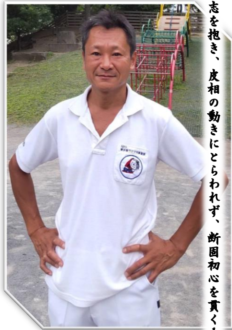
志を抱き、皮相の動きにとらわれず、断固初心を貫く！