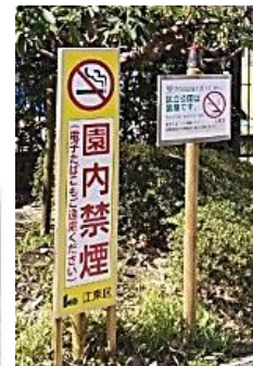
区立公園と児童遊園の全面禁煙化の実現