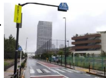
有明にぎわいロード