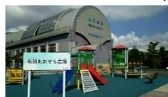
有明あおぞら広場新設