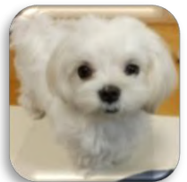
愛犬のナツ(女の子)