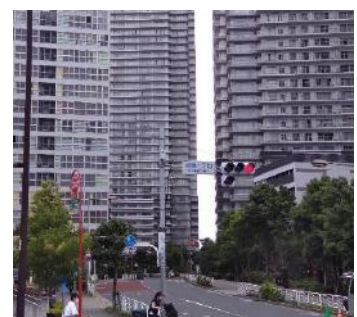
東雲一丁目交差点