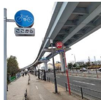
ゆりかもめ下の都道