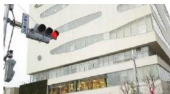
東雲地区交差点信号機新設