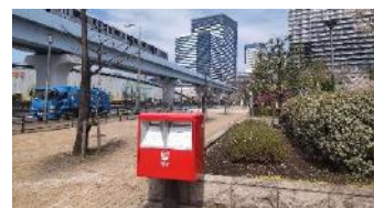
豊洲六丁目第二公園へ郵便ポスト新設