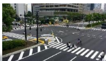
深川五中前横断歩道新設