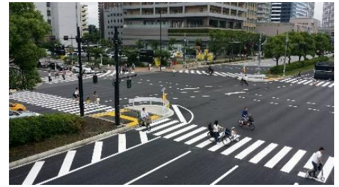
有明あおぞら広場新設