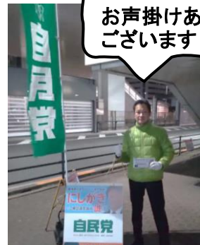
定例駅頭活動 (区内15カ所 5:30~9:30)