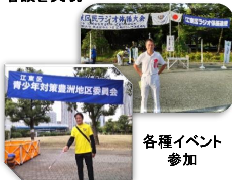
各種イベント参加