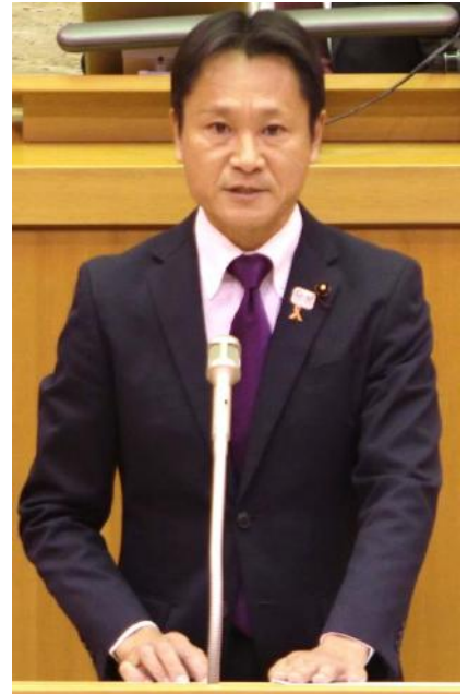
志を抱き、皮相の動きにとらわれず、断固初心を貫く！