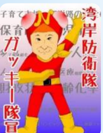
湾岸防衛隊 保育ガッキー隊員

(※) <<教育の多様化とは>> 「雪が解けたら何になるか?」という問いに、知性教育では「水になる」、感性教育では「春になる」という答えもあり得る。(参照:日本教育新聞)