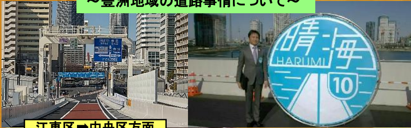
江東区⇒中央区方面

首都高速10号晴海線の豊洲出入口から晴海出入口の1.2キロが3月10日に延伸されました。臨海部と都心のアクセスが強化され、朝晩の豊洲地域の混雑緩和が見込まれると共に、緊急時の救命活動や物資の輸送など、重要な役割が期待されます。