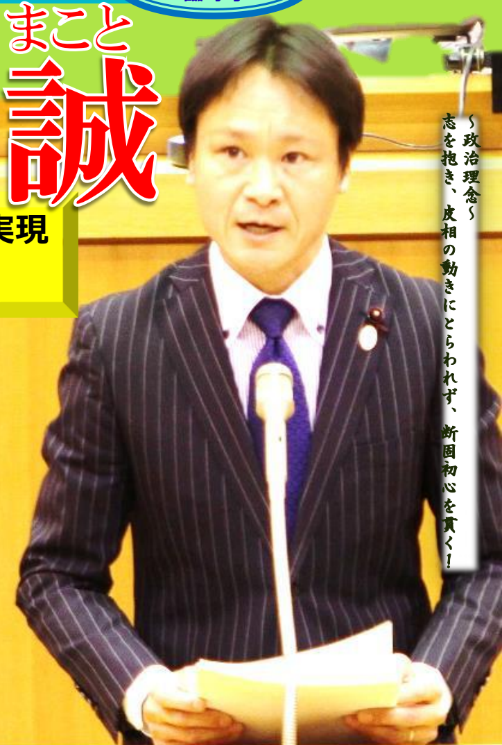
「政治理念」 志を抱き、皮相の動きにとらわれず、 断固初心を貫く！